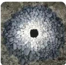
Afbeeldingen binnenin: werken van Andy Goldsworthy