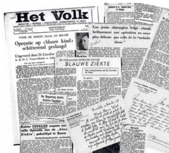
Het nieuws van de geslaagde 'blauwziekte-operatie' haalde binnen- en buitenlandse kranten.