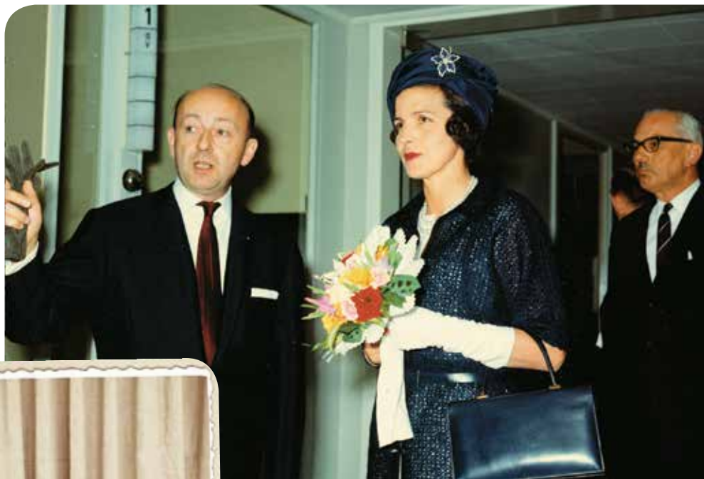
Prinses Lilian bemiddelde bij de aankoop van een kunsthart voor het ziekenhuis.