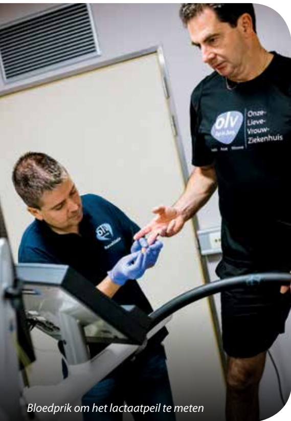
Bloedprik om het lactaatpeil te meten

Rond nieuwjaar nemen velen het voor-nemen om meer te sporten. Veelal begin-nen ze zonder degelijk plan of begeleiding. Dat kan anders! Via een aantal tests kunt u leren welke belasting uw lichaam aankan.