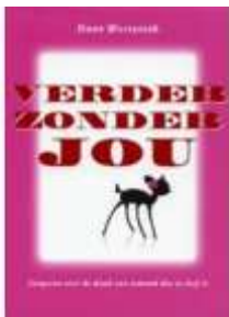
Verder zonder jou Daan Westerink Ten Have, 2010, 240p.

Je bent jong en iemand die je lief is, overlijdt. Alles is ineens anders. Mensen in je omgeving weten niet altijd hoe ze met je moeten omgaan. En zelf aangeven wat je nodig hebt is ook niet makkelijk. Hoe ga je dan verder?