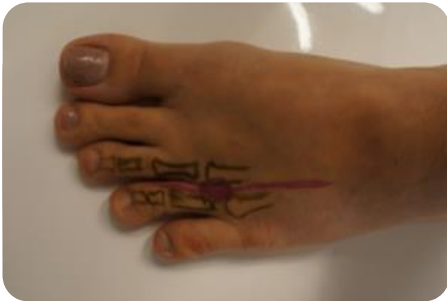
Inklemming van interdigitale zenuw

De pijn ontstaat tijdens belaste activiteiten van de voeten zoals stappen. Patiënten hebben meestal geen last van pijn in rust. Het dragen van schoenen met een smalle neus of hoge hakken maakt de pijnklachten meestal erger. Hierdoor neemt de druk op de botjes van de tenen toe waardoor de zenuw meer klem komt te zitten.