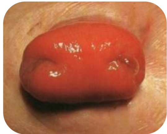
Dubbelloops of loopstoma