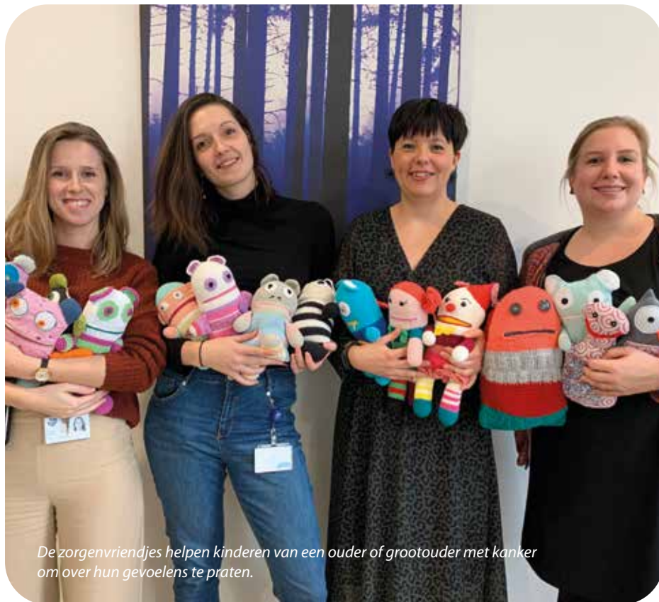
De zorgenvriendjes helpen kinderen van een ouder of grootouder met kanker om over hun gevoelens te praten.

"Als ouder kan je de inhoud van het zorgenvriendje bekijken om de angst en de zorgen van jouw kind te achterhalen. Zo krijg je de kans om over deze zorgen te praten, waarvan je anders misschien geen weet hebt. Het is wel belangrijk om vooraf te vragen aan jouw zoon of dochter of jij dit mag zien of lezen."